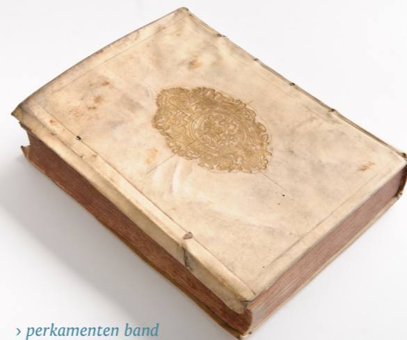
> perkamenten band

Ook de sluiting kan bijdragen tot het decoratieve karakter van de band. De ene lederen band heeft twee klamsluitingen die decoratief uitgewerkt zijn. Daarnaast draagt hij ook kantbeslag. De andere lederen band heeft groene sluitlinten. Sluitingen dienen in de eerste plaats om het boekblok te beschermen tegen stof en ongedierte en ook om te voorkomen dat de band gaat kromtrekken of openkieren en dat de bladen gaan golven.