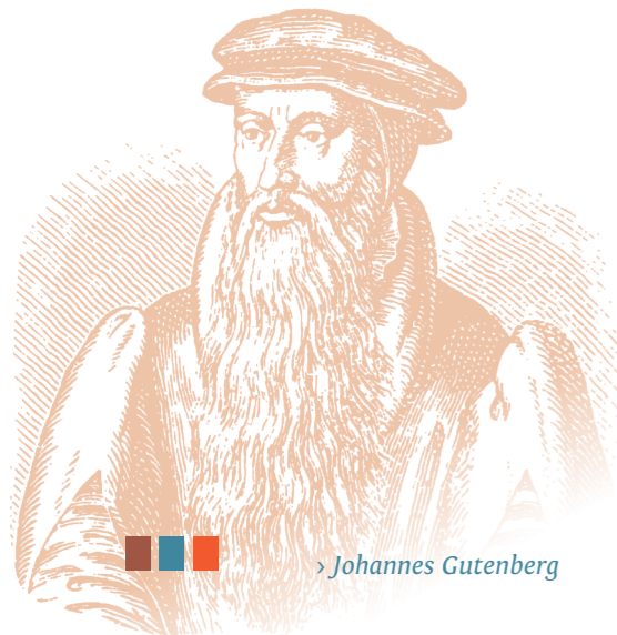
> Johannes Gutenberg

Een bijzondere vorm van het boek is het convoluut. In feite is dit een band waarin één of meer publicaties samengebonden zijn om ze gemakkelijker te kunnen bewaren in een boekenkast. Vaak handelen deze publicaties over eenzelfde of over een verwant onderwerp. Het zijn vooral brochures die in een convoluut samengebonden worden. Maar ook enkelbladige en dubbelbladige drukken en zelfs meerdere ééndelige werken kunnen erin voorkomen.