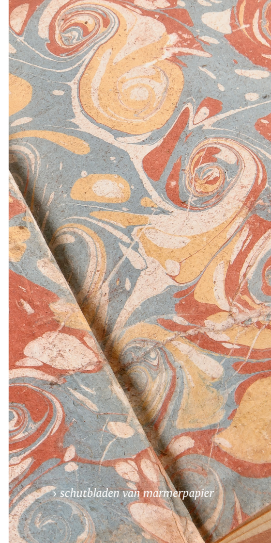
› schutbladen van marmerpapier

Bij de keuze van de stukken overweegt in de eerste plaats het educatieve oogmerk. We geven geen uitputtende opsomming van alle karakteristieken van het oude boek maar brengen enkel de hoofdkenmerken. Daarnaast tonen we niet zozeer onze pronkstukken maar gebruiken we de gewone banden, die kwamen namelijk het vaakst voor. Het brede publiek heeft ook de meeste kans om deze banden in handen te krijgen, al was het maar bij de opruiming van een oude bibliotheek, een zolder of een kelder.