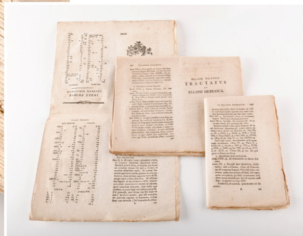
> van bedrukt vel tot gevouwen katern

Om de opbouw van een oude druk te verduidelijken vertrekken we vanuit het voorbeeld van een boek. Dit bestaat uit bedrukte vellen papier die tot katernen gevouwen worden. De katernen vormen samen het boekblok . En het boekblok wordt uiteindelijk in een band gevat.