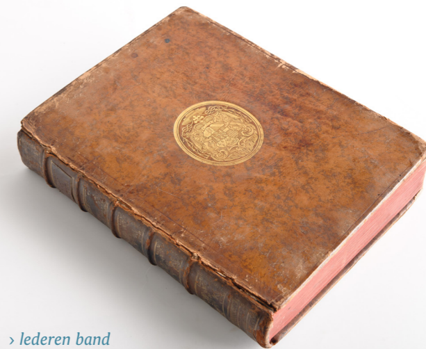
> lederen band