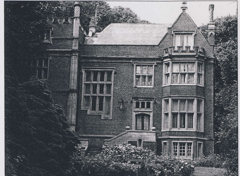
Het kasteeltje De Boterberg.