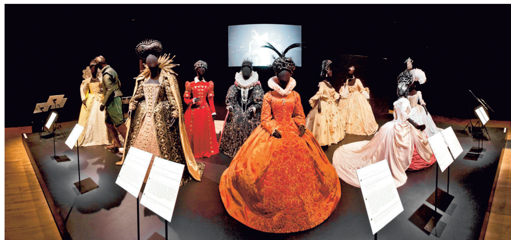
● De expo Hollywood Costume in het Londense Victoria and Albert Museum zet kostuumontwerpers (van filmklassiekers) in de bloemen.

Voor het pronkstuk van de tentoonstelling is het al te laat. De rode schoentjes die Dorothy draagt in de technicolorfilm The Wizard of Oz zijn Amerikaans erfgoed en mochten maar een maand uitgeleend worden. Van de schoentjes werden er maar vier paar gemaakt. Bezoekers die nu nog langsgaan, krijgen een replica te zien.