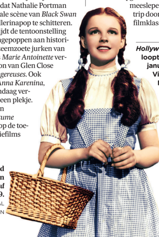
Hollywood Costume loopt nog tot 27 januari in het Victoria and Albert Museum, Londen. Reserveren is aangewezen.

● Judy Garland als Dorothy in The Wizard of Oz , 1939.