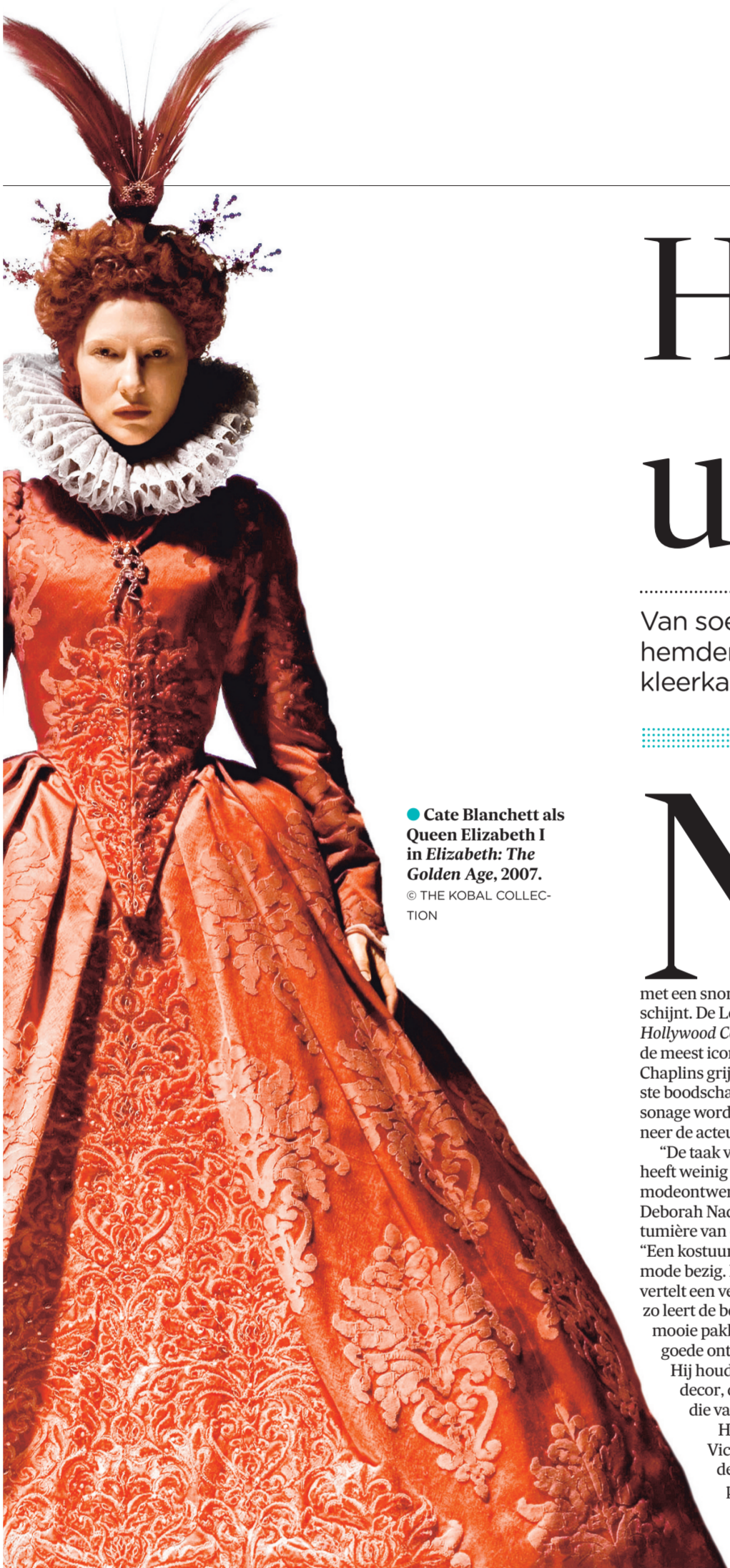
● Cate Blanchett als Queen Elizabeth I in Elizabeth: The Golden Age , 2007.